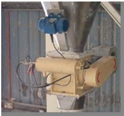
ロータリーバルブ