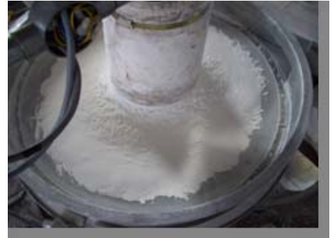
ジャイロシフター(ふるい)