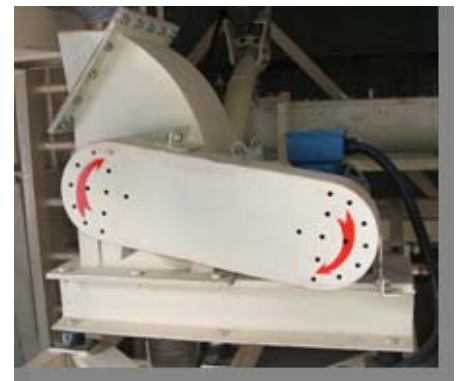
ハンマーミル(粉砕)

この装置は原材料の粉末をサイズごとに振り分け、乾燥、粉砕、を行い袋詰する装置です